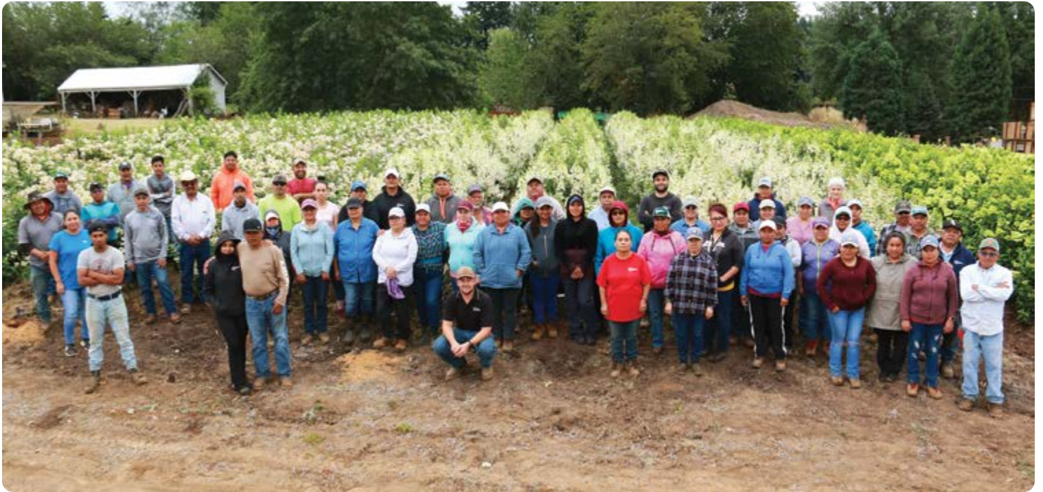
Las flores otoñales de nuestros bloques de hydrangeas son un excelente telón de fondo para nuestra primera foto de todo el personal del rancho desde Covid

A diferencia del año pasado, disfrutamos de un clima otoñal muy agradable y seco, lo que lo convierte a una excelente temporada de sacada de árboles a principios de otoño en HF. Este año completamos una meta con récord de sacar y enviar 450,000 árboles a los ranchos de Hood Acres y Barlow Sunset para la plantación de otoño. El año pasado tuvimos un otoño muy húmedo y apenas pudimos sacar 75.000. También enviamos un récord de 180,000 macetas de otoño. Esto es casi el doble de las macetas del año pasado. No podríamos haberlo hecho si no tuviéramos un gran equipo. Se necesita mucha planeación y organización no solo aquí, sino en toda la compañía, para lograr algo como esto.