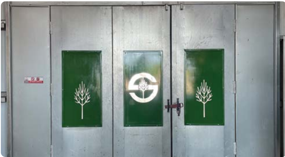
Las atractivas puertas de la cabina del taller son obra de David Montgomery.

Después de muchos meses de planeación, El Taller de Fabricación de Hood Acres ha crecido considerablemente. Gracias a los esfuerzos y la dedicación del equipo de mantenimiento del Departamento 17, la expansión es uno de los muchos proyectos actuales de gran escala. La reciente renovación agregó casi 1,400 pies cuadrados de espacio de taller para el departamento de reparación que siempre se encuentra en constante crecimiento. El proyecto ha creado un ambiente de trabajo más cómodo y productivo para los empleados del taller de fabricación.