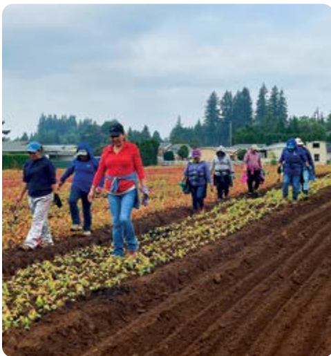
Equipo de HF pisando la tierra alrededor de las 170,000 macetas de otoño de Red Maple que trasplantamos este año en HF. Estos van a hacer unos excelentes árboles para la cosecha del próximo año.