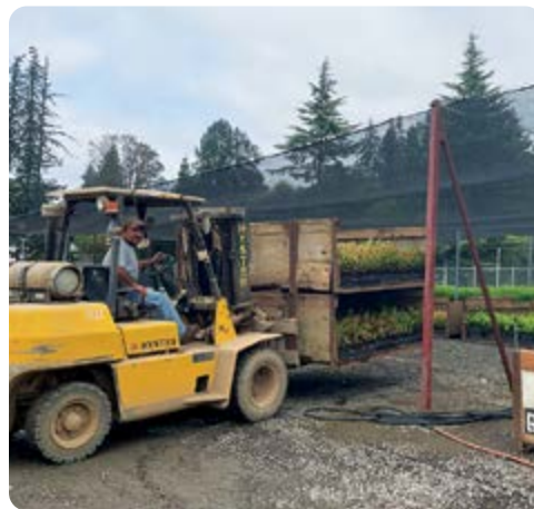
Juan Martínez-Valencia saca algunas de las 180,000 macetas para la plantación de macetas de otoño que distribuimos para alinear en los ranchos de árboles de raíz. Juan celebrará su aniversario de 15 años con la compañía el 4 de diciembre. Le agradecemos por todos sus años de servicio y dedicación para ayudar a cultivar los mejores árboles de raíz en la industria de los viveros.