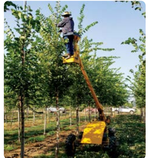
El entrenar los árboles es una de las actividades más importantes en Northwest Shade Trees, ya que mantiene ocupados a tres empleados durante todo el año. Bernardo Hernández está en lo alto, dando forma a la copa de los árboles de 2 años.