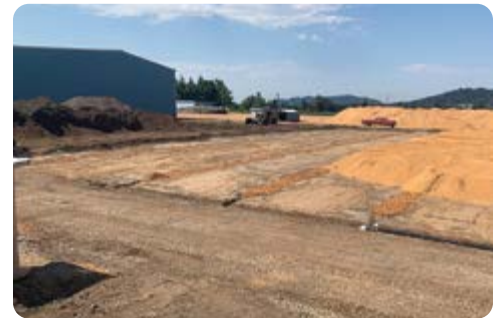
Una montaña de aserrín viejo a la izquierda, que pronto será reemplazada con aserrín nuevo a la derecha. Camioneta para darse idea del tamaño.