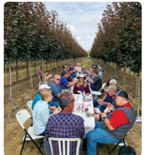
Los turistas de árboles disfrutaron de un almuerzo durante nuestra reunión de ventas de otoño en medio de los surcos de Crimson Sunset® Maples los cuales están listos para el paisaje.