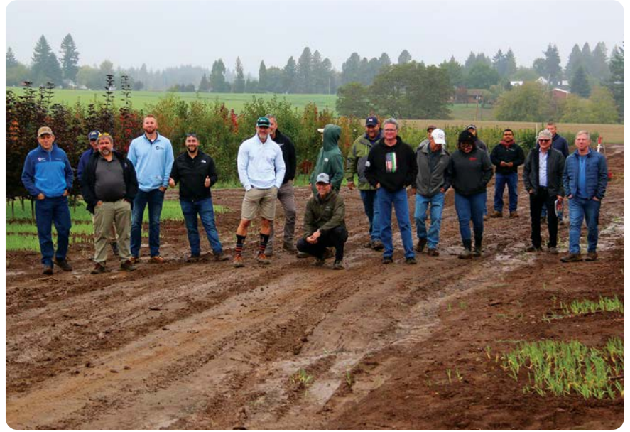
Equipo de Ventas pausa durante nuestro tour de ventas del otoño.