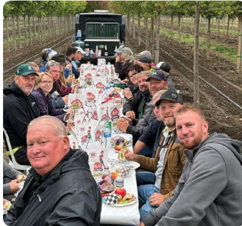
El equipo de ventas de la JFS se reúne para comer durante el tour de las juntas de ventas del otoño en NWST.