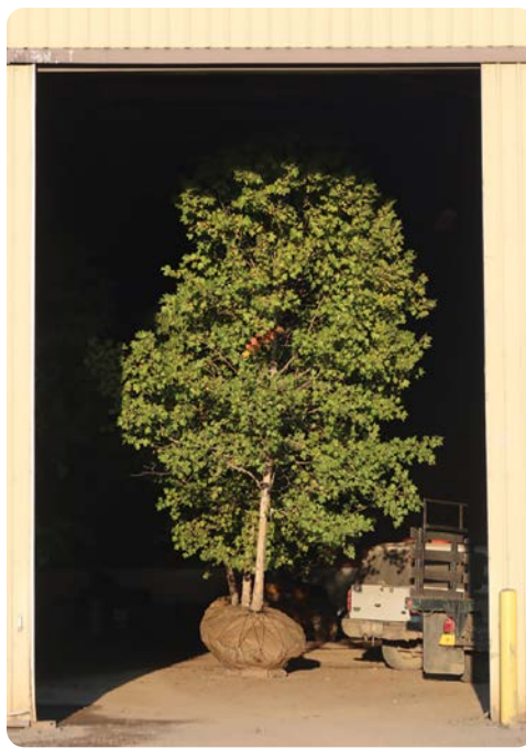
¡Grande!!! ¡Exclamation!® Planetrees, calibre de tronco de 5", recién sacado y listo de ser enviado a Washington Landscape Installation por clientes de mucho tiempo, Teufel Nursery Inc.