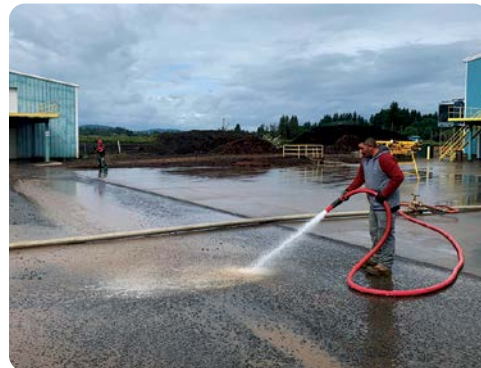
Ricardo Vázquez (a frente) y Welfri Sales lavan el lodo, clavos, y piedras del concreto en frente del refrigerador #7.

En los refrigeradores, las cuadrillas están trabajando reemplazando tablas quebradas y desgastadas y lavando a presión las superficies para que estén limpias para el almacenamiento. Comenzar con una superficie de trabajo limpia ayuda a reducir los problemas de enfermedades y crea un ambiente de trabajo más seguro para nuestros empleados.