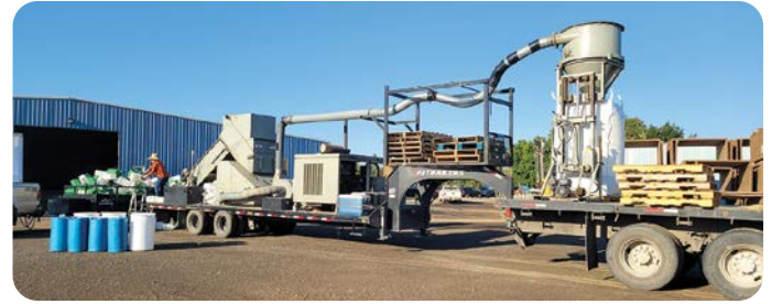
Ser el anfitrión del evento de reciclaje de contenedores de pesticidas fue fascinante. Los contenedores vacíos y enjuagados 3 veces fueron echados a la máquina para ser triturados, procesados y empacados en bolsas gigantes para ser transportados.