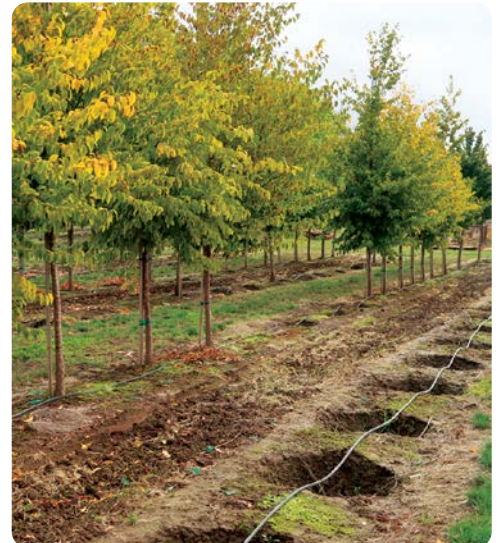
Los surcos de American Hophornbeam ( Ostrya Virginiana ) de calibre de tronco de 2" parecen queso suizo con los hoyos de los árboles que fueron vendidos la temporada pasada.