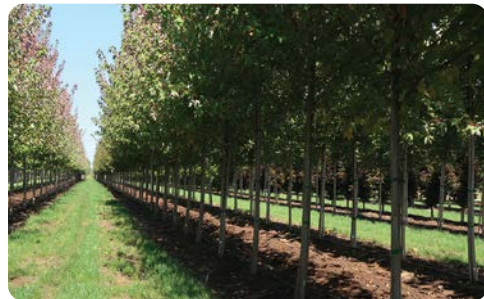
Surcos de los Redpointe® Maples de 3 años, listos para la cosecha

También hemos sacado tempranamente algunos árboles grandes que habían sido podados de raíz en invierno para sacar a fines del verano para acomodar los planes de plantación de algunos grandes proyectos de jardinería. ¡Nuestro Planetrees Exclamation!® con calibre de tronco de 5" pesaban alrededor de 2,700 libras cada uno! La cosecha principal comenzará después de la caída de las hojas. Por ahora, los surcos están llenos de árboles esperando a ser sacados. A diferencia de los cultivos de árboles de raíz, sacamos cada árbol individualmente y dejando el vivero a parecer como un queso suizo, lo que hace muy contento al Gerente del Rancho, Martin Hanni, quien es de Suiza.